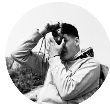
Martin Depont Graphiste